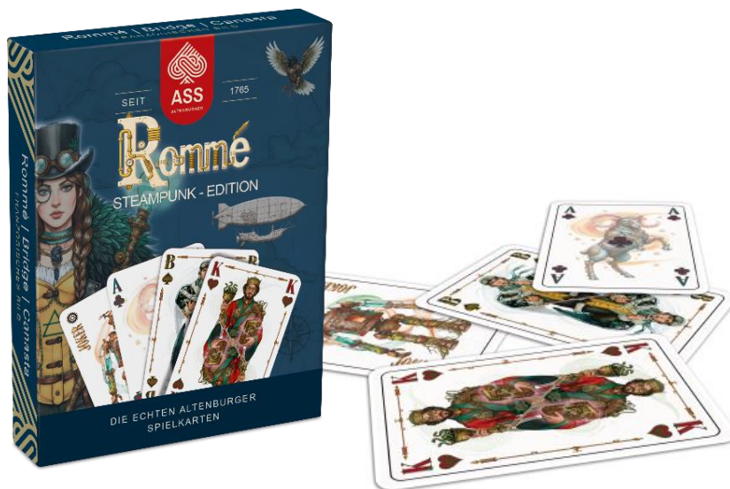
Abbildung nicht final!

Das Special Rommé greift nicht nur die Ästhetik der Steampunk-Szene auf, sondern erzählt durch die eigens kreierten Charaktere ganz viel Geschichte. Jede Person verkörpert eine eigene Rolle, welche durch verschiedene Gegenstände und Icons in den Illustrationen zum Ausdruck gebracht wird. Vertreten sind Heiler & Künstler (Herz), Denker & Ingenieure (Pik), Händler & Handwerker (Karo), Kämpfer & Rebellen (Kreuz). Begleitet werden die Charaktere jeweils von einem magischen Tier, sowie von den vier Elemente Feuer, Wasser, Erde und Luft. Auf diese Weise entsteht eine Welt, in der Magie, Technik und Symbolik eine gemeinsame Sprache sprechen und die Figuren zu Trägern ihrer eigenen Geschichte werden. Das Kartenset wird somit zu einem echten Hingucker und ist wie der Name schon sagt, einfach „special“.